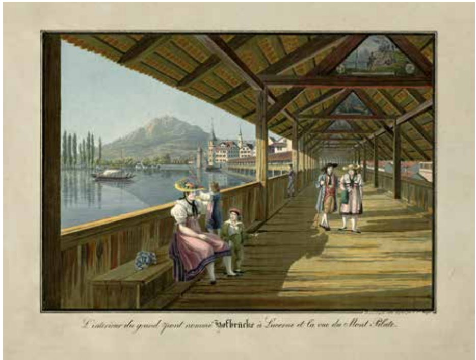
L'intérieur du grand pont nommé Hofbrücke à Lucerne et la vue du Mont Pilate.

Prachtvolle Darstellung der Hofbrücke mit dem dreieckförmigen Gemäldezyklus und einer charmanten figürlichen Staffage im Vordergrund.